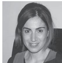
Antonella Giordano Ufficio Stampa Credit Village